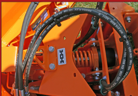
Der V-Pflug ist mit einer horizontalen flex-geerdeten Aufhängung befestigt, die vor frontalem Zusammenstoßen schützt