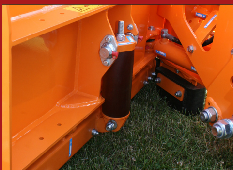
Der gefederte Abschnitt ist so aufgeteilt, dass nur der Teil, der ein Hindernis erkennt, weg kippt