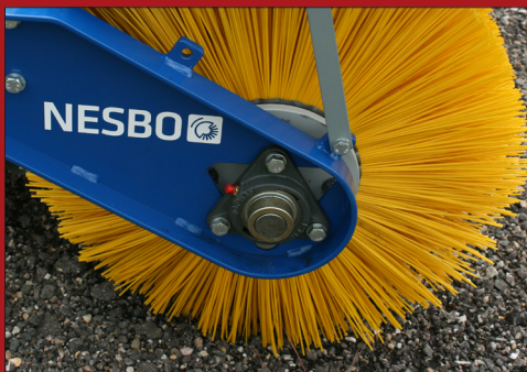
Der Hydraulikmotor ist praktisch in der Bürstenwalze angebracht, was eine optimale Ausnutzung der vollen Breite des Besens bieten.