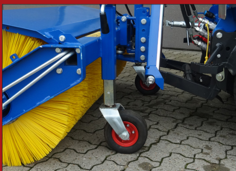
Der Besen ist mit 2 robusten Höhenrädern ausgerüstet, die ein optimales Ergebnis sichern.