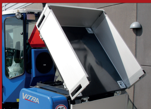
Ladet kan som tilvalg, leveres med hydraulisk tip, hvilket giver mulighed for aflæsning direkte i udvalgte spredeløsninger.