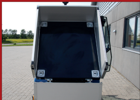
Ladet er forsynet med plan bund som er forsynet med undersænkede surringskroge i hvert hjørne.