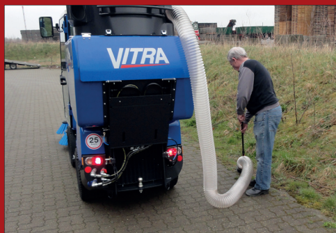
Fejesusge anlægget er som standard udstyret med smart håndholdt sugeslange som giver stor fleksibilitet.

Vitra blev belønnet med en "Innovations medalje" på en af Tysklands mest anerkendte messer, for "Enestående teknik som tager hensyn til miljøet"