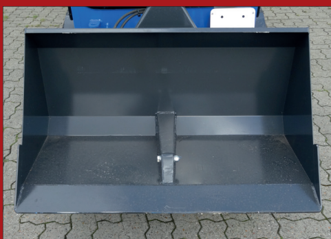
Skovlen er opbygget, så der kan arbejdes helt til kant, så arbejdes bredden udnyttes optimalt.