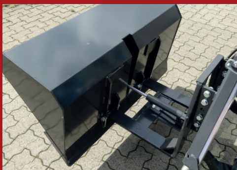
Den robuste og dog stadig kompakte opbygning sikre en høj nyttelast og lav egenvægt.