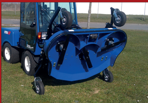
Hele klippebordet kan tippes op, så der opnås let adgang til service og rengøring. Som tilvalg er hydraulisk tip mulig.