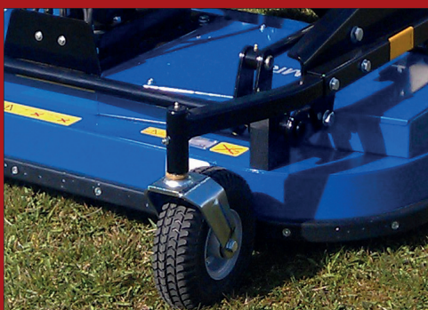
Klipperen er monteret med kraftige gummi hjul både foran og bag klippeborde, for optimal stabilitet