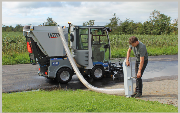
Der externe Saugschlauch ermöglicht eine manuelle Schmutzaufnahme auch in den unzugänglichsten Ecken, da wo das Frontdeck nicht eingesetzt werden kann.

Der neue Kehranlage Vitra C2 ist optional mit verschiedener Ausstattung erhältlich, unter andere Poly-, Stahl- oder Mischbürsten, Hochdruckreiniger mit 10-m-Schlauchtrommel und Handlanze.