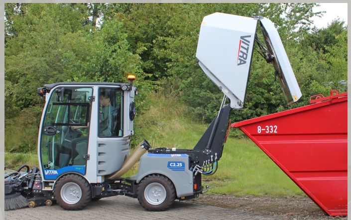
Die Containerentleerung wird direkt aus der Kabine gesteuert. Mit einer Kipphöhe von 175 cm ist es möglich den Sauggutbehälter direkt in einen Abfallcontainer oder Anhänger zu entleeren.