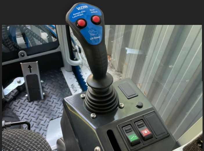
Die c2-reihe ist ebenfalls funktional und einfach zu bedienen, um ein effizientes und präzises arbeiten zu gewährleisten, egal für welche aufgaben.

" Eine einzige Maschine für alle Aufgaben des Jahres "