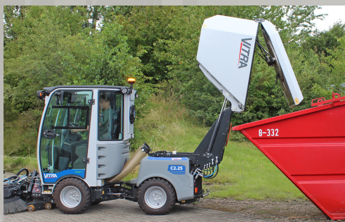
Containeren tømmes direkte fra kabinen og med aftip i 175 cm. højde kan tømning ske direkte i affaldscontainer eller trailer