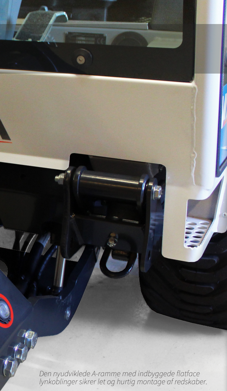
Den nyudviklede A-ramme med indbyggede flatface lynkoblinger sikrer let og hurtig montage af redskaber.