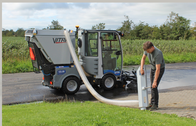
Med den ekstern sugeslange er der mulighed for effektiv renholdelse hvor det ikke er muligt at køre med maskinen

Den nye serie af Vitra fejesegeanlæg lever selvfølgelig også op til alle gældende krav til EUcertificering PM2,5/10.