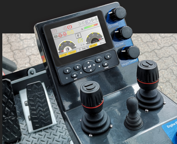
C3-Serien manøvreres let med de 2 proportionale joystick, som sikrer at den intuitive betjening kan udføres millimeter præcist

Det letbetjente manøvreresystem sikrer let og hurtig oplæring af nye brugere, samt effektiv og nøjagtig betjening, uanset arbejdsopgaven. C3-Serien er udstyret med et nyt proportionalt PTO system, som nemt styres fra den indbyggede skærm i armlænet og giver optimal flowkontrol og optimerer driften af hvert enkelt redskab.