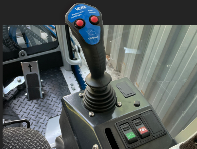
Også C2-serien er opbygget med funktional og let betjening som sikrer effektiv og præcis kontrol, uanset opgaven

" Kun behov for én maskine til alle årets opgaver "